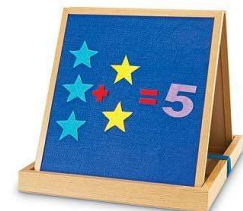
บอร์ดติด