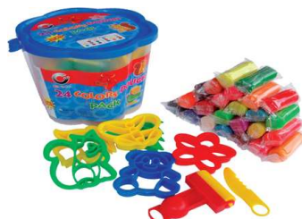
แป้งโดว์